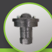
Auto Air Vent Valve

گروه مهندسی آبین توانایی جایگزین کردن فیلترهای دیسکی به جای فیلترهای توری را با هر مارک و هر سایزی دارا می باشد. با اتصالاتی که در ورودی و خروجی فیلترهای دیسکی تعبیه شده می توان این فیلترها را به کلکتورهای ساخته شده گروه مهندسی آبین متصل نمود.