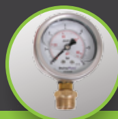
Oil Pressure Gauge